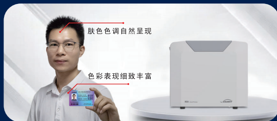
采用热升华打印的照片品质输出